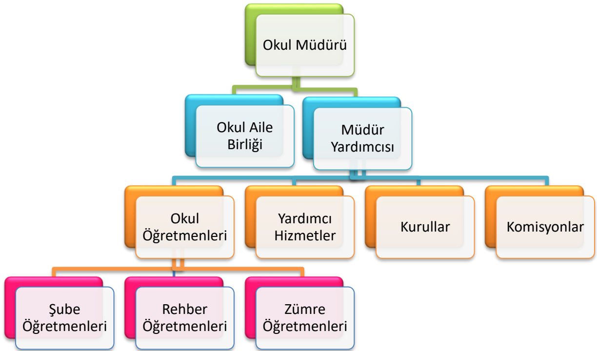
Şekil 4. Yönetim Organizasyon Şeması