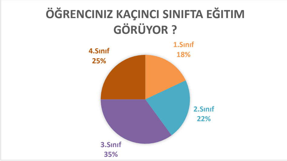
Şekil 3. Veli Anketine İlişkin Görsel

Velilerimize yöneltilen ankete okulumuz velilerinden 187 velimizin katılım sağladığı görülmüştür. Anketten elde edilen veriler analiz edildiğinde okuldan ve yapılan etkinliklerden velilerimizin yüksek oranda memnun oldukları, en yüksek memnuniyet oranının “Okulumuz, çocuğumun ahlaki gelişimini teşvik eder.” Maddesi ile ilişkili olduğu, bunun yanı sıra ise okulda güvenlik personeli ve yardımcı personel talebinin olduğu görülmüştü