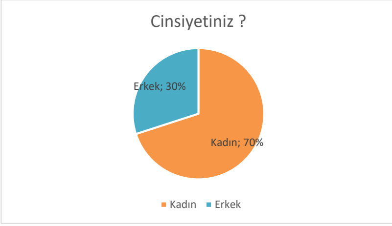
Şekil 2. Öğretmen Anketine İlişkin Görsel

Öğretmenlerimize yöneltilen ankete okulumuz öğretmenlerinin tamamı tarafından katılım sağlanmıştır. Anketten elde edilen veriler analiz edildiğinde yaklaşık %85 oranında öğretmenlerimizin okulumuza ait misyon ve vizyonu tam olarak anladıkları, temizlik, güvenlik, yönetim süreçleri konularında olumlu fikre sahip oldukları, aramıza yeni katılan öğrencilere gerekli desteği sağlama noktasında okulumuzu etkili buldukları, öğretmenlerin mesleki gelişimlerinde destek gördükleri sonucuna ulaşılmıştır.